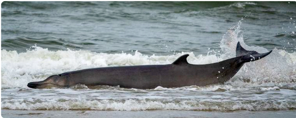
Een uitgeputte en spetterende dolfijn in de branding

Direct werd SOS Dolfijn ingeseind. Zij gaven het advies om weg te blijven van de dieren, zodat ze zo min mogelijk stress hadden. De melding bij SOS Dolfijn werd gedaan door de reddingsbrigade waarna de KNRM ook direct in actie kwam om de "redding" bij te staan.