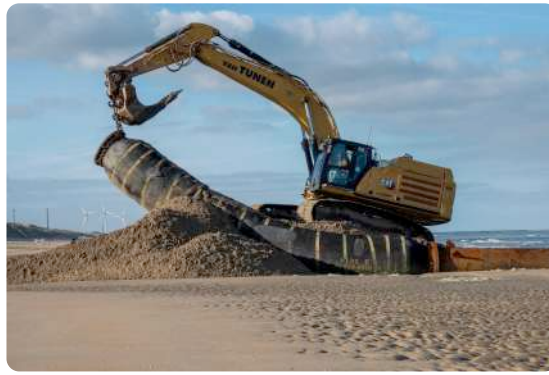
De buizen werden gepositioneerd