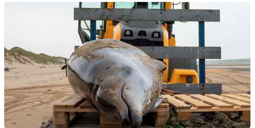
Een mogelijke verklaring voor het aanspoelen zou een eerdere infectie in de hersenen en het hersenvlies kunnen zijn, aldus het onderzoeksrapport van Universiteit Utrecht.

Het was heel indrukwekkend en treurig om deze grote dolfijnen afgevoerd te zien worden. Er werd menig traantje weggepinkt door de omstanders.