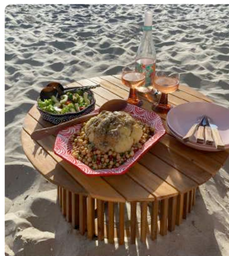
Gezond, vegetarisch en gemakkelijk

Kook de bloemkool ongeveer 10 voor en laat uitlekken, zet hem op een alu schaaltje of wikkel hem in z'n geheel in alufolie en zet hem ongeveer 25 minuten in een warme bbq tot hij gaar en goudbruin is. Spoel intussen de kikkererwten af en laat uitlekken. Meng ze in een kom met de peterselie en granaatappelpitjes. Roer in een ander kommetje de tahin, honing, citroensap en wat water tot een mooie romige dressing. Schep het kikkererwtensmengsel rond de bloemkool en lepel de dressing erover. Garneer met de za'atar. Eet smakelijk!!