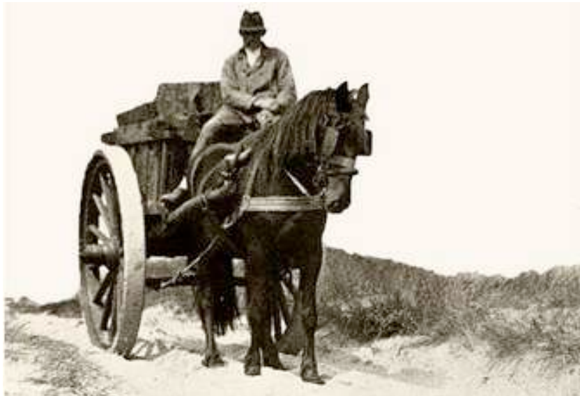
Het was hard werken voor het paard, dat de zware lading schelpen door het rulle zand moest trekken

Eeuwenlang was het een vertrouwd gezicht op de stranden van Heemskerk, Bakkum en Castricum: karren met grote houten wielen, volgeladen met schelpen en voortgetrokken door zwoegende paarden. Bovenop zetelden de schelpenvissers, harde werkers met door weer en wind getekende gezichten.