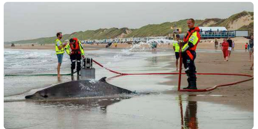
De eerste dolfijn was aangespoeld en werd natgehouden