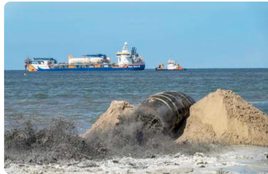
Op 9 mei werd het laatste zand opgespoten

Op zondag 26 april arriveerde het opvallende schip de Vox Apolonia voor de kust. Dit moderne schip vaart op LNG (vloeibaar aardgas). De slephopperzuiger zoog eerst grote ladingen zand van de bodem van de Noordzee. Vervolgens voer de Vox Apolonia naar het begin van de zinkerleiding, koppelde daar aan en perste het zand, gemengd met water, met grote kracht door de leiding, zo het strand op. Daar werd het zand met bulldozers verder verspreid en uitgereden. Elke vier uur kwam zo een lading vers zand op het strand terecht – dag en nacht!