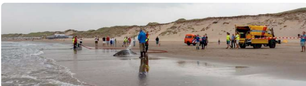
Tijdens de reddingsoperatie was er veel bekijks

Het was zo'n wanhopig en treurig gezicht: twee van die kolossale (+/- 750 kg), geweldig grote zoogdieren, die hopeloos lagen te spartelen in de branding. Als je dit ziet, dan wil je iets doen: helpen en redden! Omstanders hebben nog één dolfijn proberen terug te duwen in de zee. Dat lukte aanvankelijk maar even later strandde het dier voor de tweede maal bij paal 48.500. Kort na de tweede stranding is deze dolfijn overleden. De andere dolfijn werd nat gehouden, maar kon niet meer worden gered. Ze is uiteindelijk met een spuitje uit haar lijden verlost.