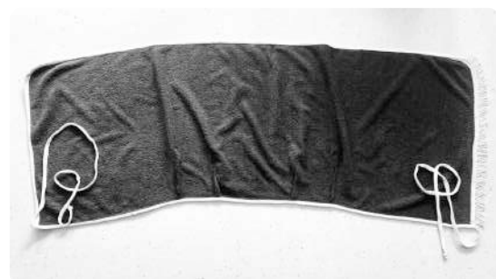
Als je rokje af is, ziet het er zo uit als je het rokje voor je neerlegt

Knip stroken van 5 cm breed uit het t-shirt en naai de smalle uiteinden van de stroken aan elkaar. Naai de coupenaadjes van de badstofrok dicht en eventueel nog 2 kleinere coupenaadjes aan de achterkant. Bies alle randen van de rok af met de t-shirt-stroken (eerst aan de verkeerde kant erop naaien, dan eromheen vouwen en op de juist kant vaststikken). Gebruik de rest van de strook als striklinten. Eventueel nog een sierrandje op het voorpand en klaar is je pareo!