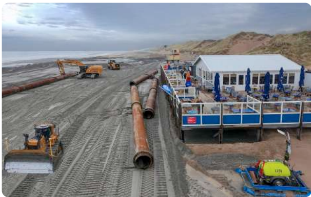
Buizen, buizen en nog meer buizen

De voorbereidingen begonnen al begin april met de aanlanding van de zogeheten zinkerleiding. Deze gigantische leiding is helemaal vanuit Zeeland over het water naar Heemskerk gesleept. Een ingewikkelde klus, die gelukkig vlekkeloos verliep. Om alles op het strand op zijn plek te krijgen, moesten er bijna 70 stalen buizen van elk 12 meter lang (in totaal zo'n 800 meter aan leidingen) plus de nodige containers en machines vanaf Beverwijk met tractoren naar het strand worden gereden.