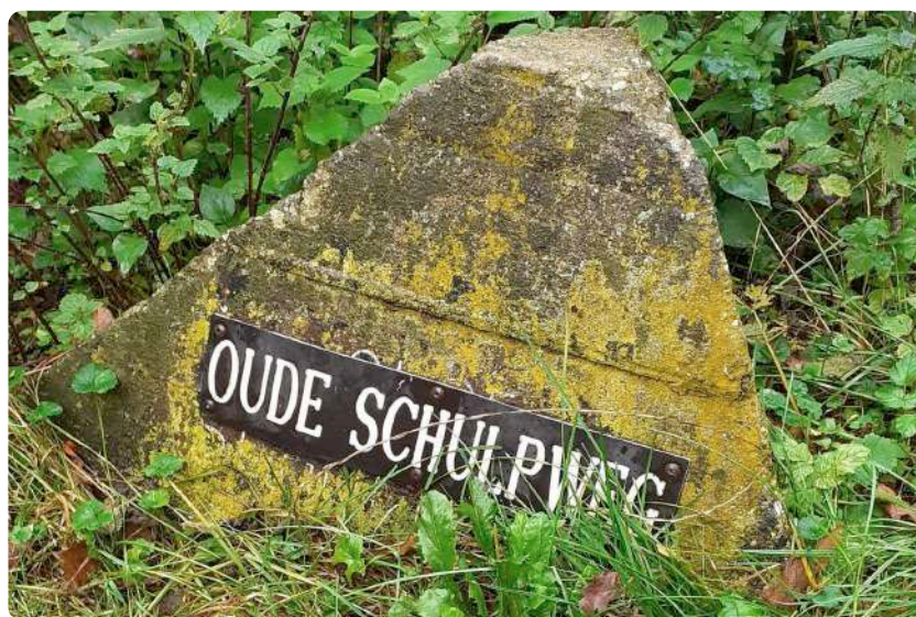
De Oude Schulpweg herinnert nog aan het traditionele beroep van de schelpenvisser

Dagelijks togen de schelpenvissers in vroeger tijden met hun kar naar het strand om daar met een beugelnet (een 'teug') schelpen te verzamelen. Wat ze vingen, laadden ze op hun wagen, en dan werd de lading afgevoerd via de duinen - de Oude Schulpweg herinnert nog aan de route die ze aflegden. Bij de speciale laad- en losplek, de Schulpstet (nu een buurtschap tussen Bakkum en Castricum), werden de schelpen overgeladen op schepen, om vervolgens naar kalkbranderijen te worden gebracht in Uitgeest of Alkmaar en vanaf 1921 ook naar Akersloot. De kalkrijke schelpjes werden vervolgens verwerkt tot metselkalk.