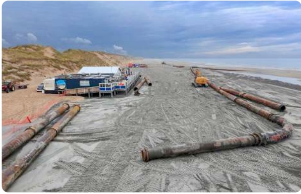
De voorbereidingen werden in april getroffen

Tekst: de redactie - Foto's: Ben Roozendaal