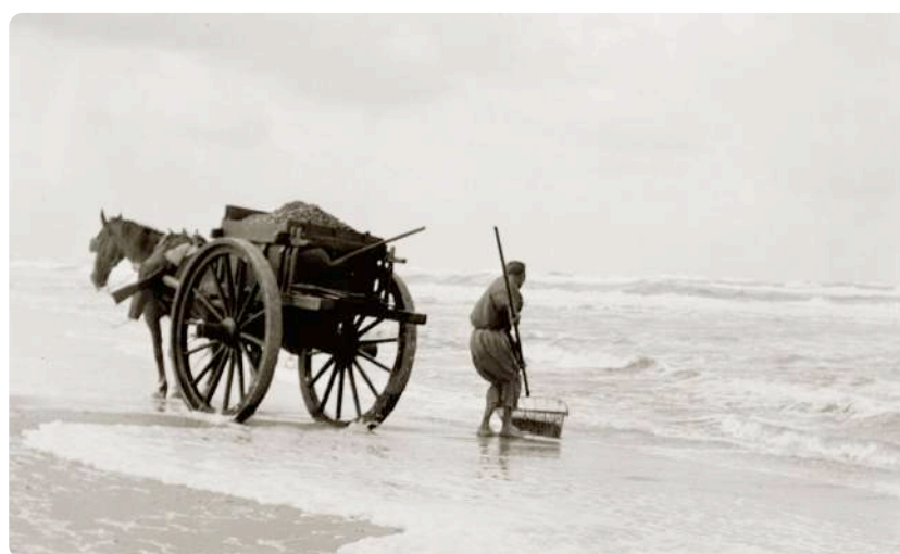
Fotograaf Jacob Olie maakte in 1904 deze prachtige foto van een schelpenvisser bij Egmond