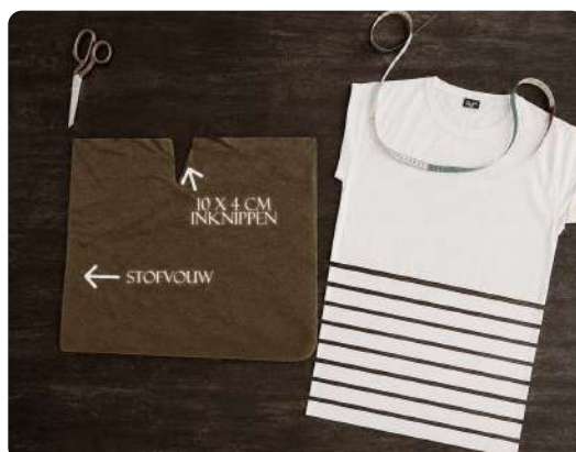
Zo knip je de handdoek en het oude t-shirt

Knip de strook badstof aan de onderrand een beetje rond en ter hoogte van de zij een klein driehoekje als coupenaad (een figuurnaad die zorgt voor een driedimensionale vorm in het kledingstuk) op je heupen voor een beetje pasvorm.